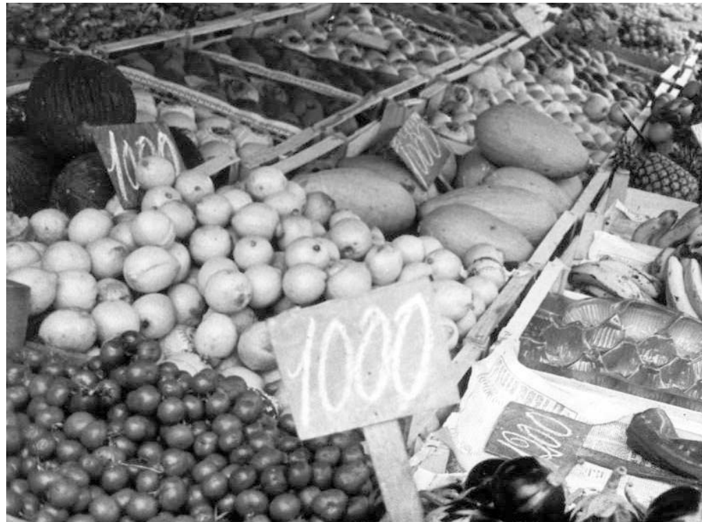
FRUTTA E VERDURA. Sono i prodotti più venduti, anche dagli abusivi