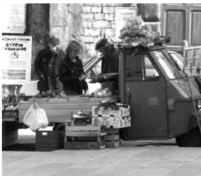
Una bancarella improvvisata